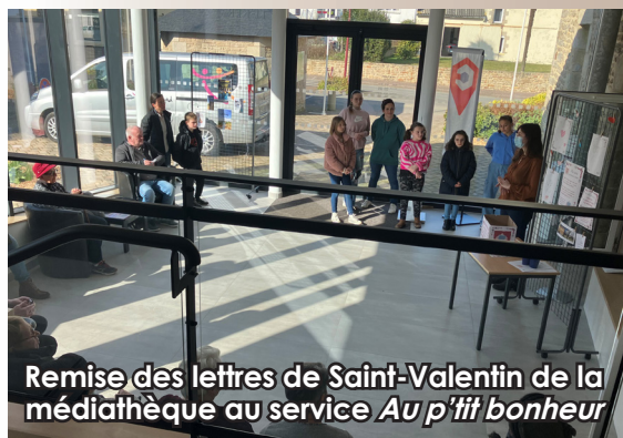
Remise des lettres de Saint-Valentin de la médiathèque au service Au p'tit bonheur

Vous avez plus de 60 ans et voulez voir du monde pour faire des nouvelles rencontres ? Le service « Au P'tit Bonheur » vous accueille le lundi, mercredi et vendredi de 11h30 à 15h30. Le but est de partager un repas et de passer un moment convivial. Diverses activités sont proposées : activités manuelles, jeux d'adresse, jeux de société, jeux de cartes, loto, promenade dans le parc... La mairie propose désormais une navette gratuite pour transporter les personnes ne pouvant pas se déplacer. Notre conseillère numérique y réalise des permanences chaque semaine.