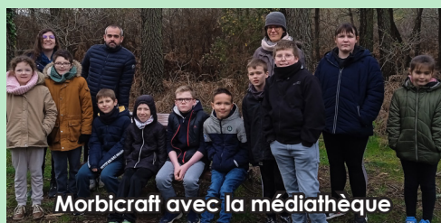
Morcraft avec la médiathèque