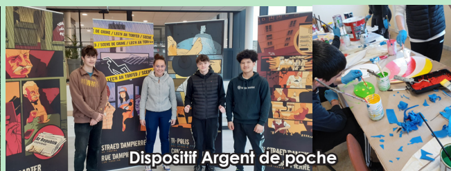
Dispositif Argent de poche